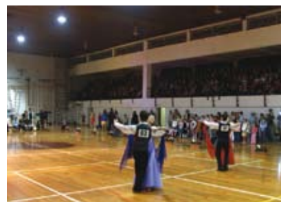
Najljepši sport napunio je dvoranu u Čazmi