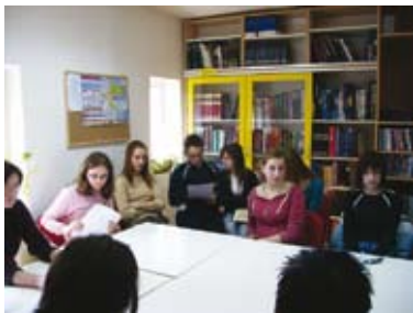
Učenici su u Grdskoj knjižnici održali sat zavičajne povijesti

Učenici I razreda Gimnazije, pod stručnim vodstvom prof. zemljopisa Željke Biškup, obavili su prezentaciju života i rada ovog istaknutog znanstvenika, odnosno održali sat zavičajne povijesti.