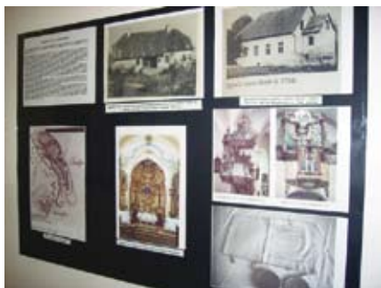
Izložbu o Čazmi kakva je bila nekad možete pogledati u holu zgrade Centra za kulturu

- fotografije Čazme od sredine 19. st. do suvremenih veduta i panorama