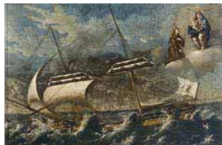
Zavjetna slika iz dubrovačke Crkve Gospe od Milosrđa

— Brojni su hrvatski znanstvenici dali doprinos raspravama o moru i pomorstvu, a neki su zaslužni i za velika