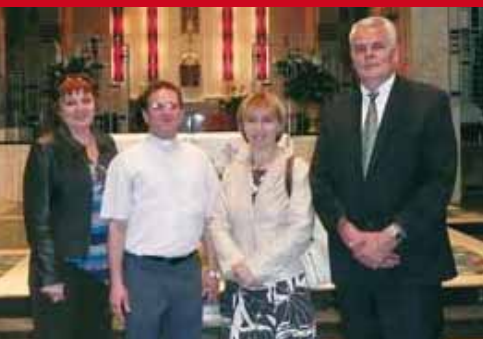
Ravnateljica HMI-a posjetila SAD