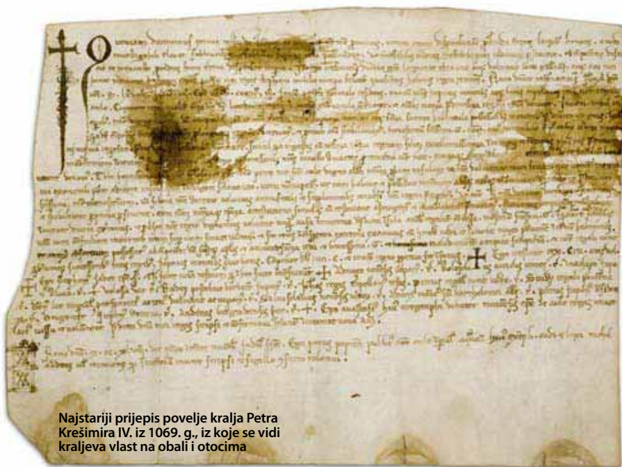
Najstariji prijepis povelje kralja Petra Krešimira IV. iz 1069. g., iz koje se vidi kraljeva vlast na obali i otocima

CB Seafaring on the Croatian Adriatic, an exhibition being held at the prestigious Maritime Museum in Barcelona from March 25th to June 30th, is presenting our rich history of seafaring in the best possible way. It is the fruit of the successful culture cooperation between Croatia and the Kingdom of Spain.