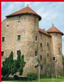
Ogulinski festival bajki